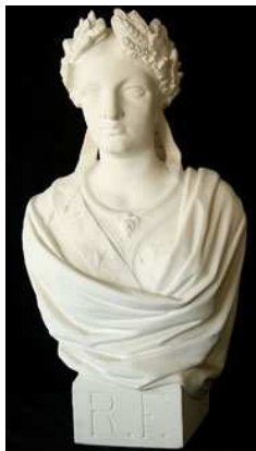
Buste de Marianne. [XX e siècle ] Tribunal d'instance de Melle.

C'est également au lendemain de la Révolution française que s'impose le type architectural des palais de justice : un édifice néoclassique. Il donne une image majestueuse de la justice.