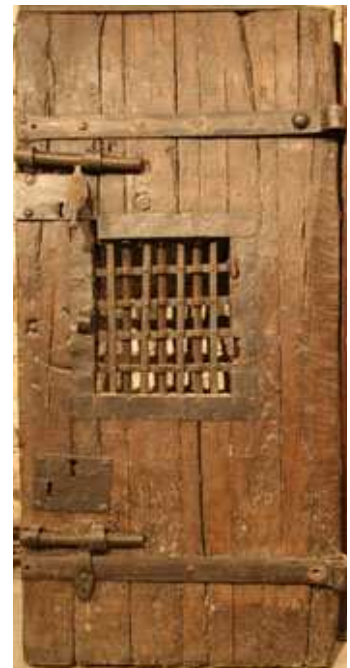
Porte de prison en chêne, provenant de l'ancienne maison centrale de Melun, XVIII e siècle. Musée national des prisons de Fontainebleau.