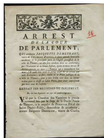
Arrêt du parlement condamnant Jacquette Demeurant à faire amende honorable, 1782, Archives départementales des Deux-Sèvres, A 5