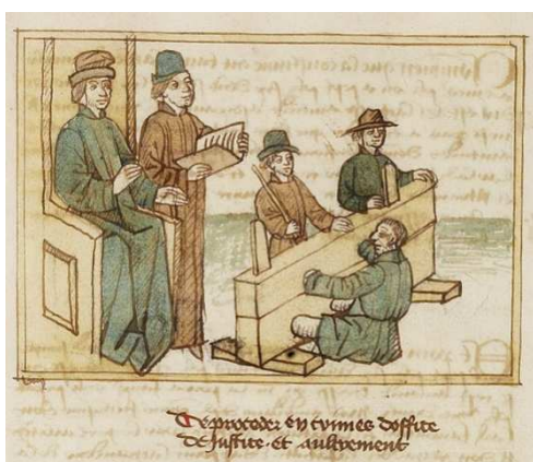
Vieux Coutumier du Poitou, comprenant 72 dessins à la plume et aquarellés, XV e siècle. Médiathèque centrale d'agglomération de Niort, réserve M 5 F.

Sont jugés à cette époque des dossiers très divers, comme les séparations de biens, les cas d'abandons d'enfants, de viols et d'agressions physiques ou verbales, ou même encore des procès de sorcellerie.